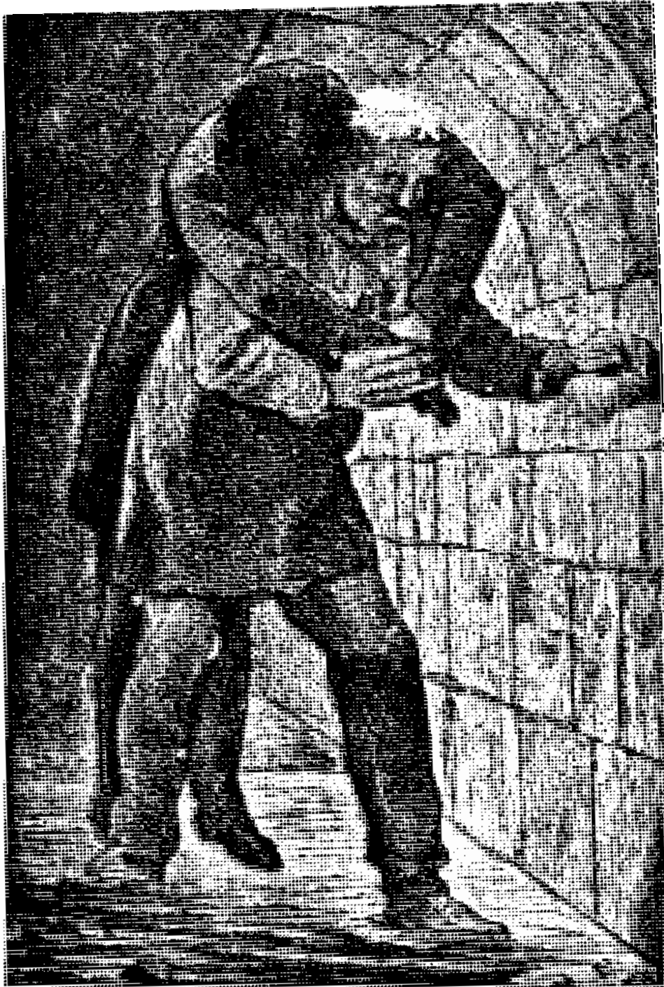
دو بازی عاریوس دور گردنش پیچیده و باهای او بر پشتش بود