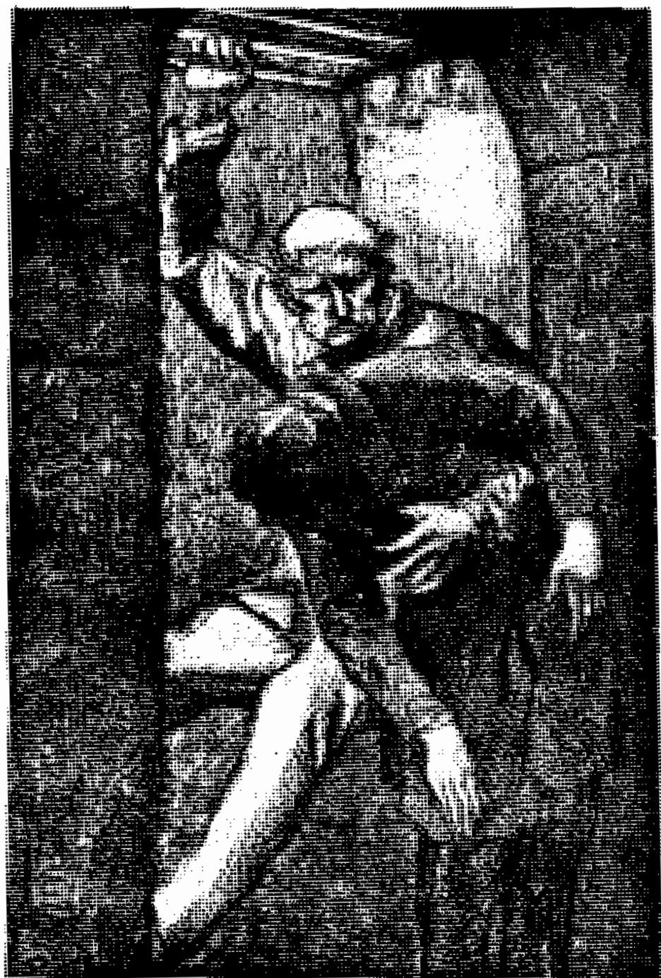
خود را با مارپوس که همچنان مدهوش بود دریاك نوع دهلیز زیر زمینی دید