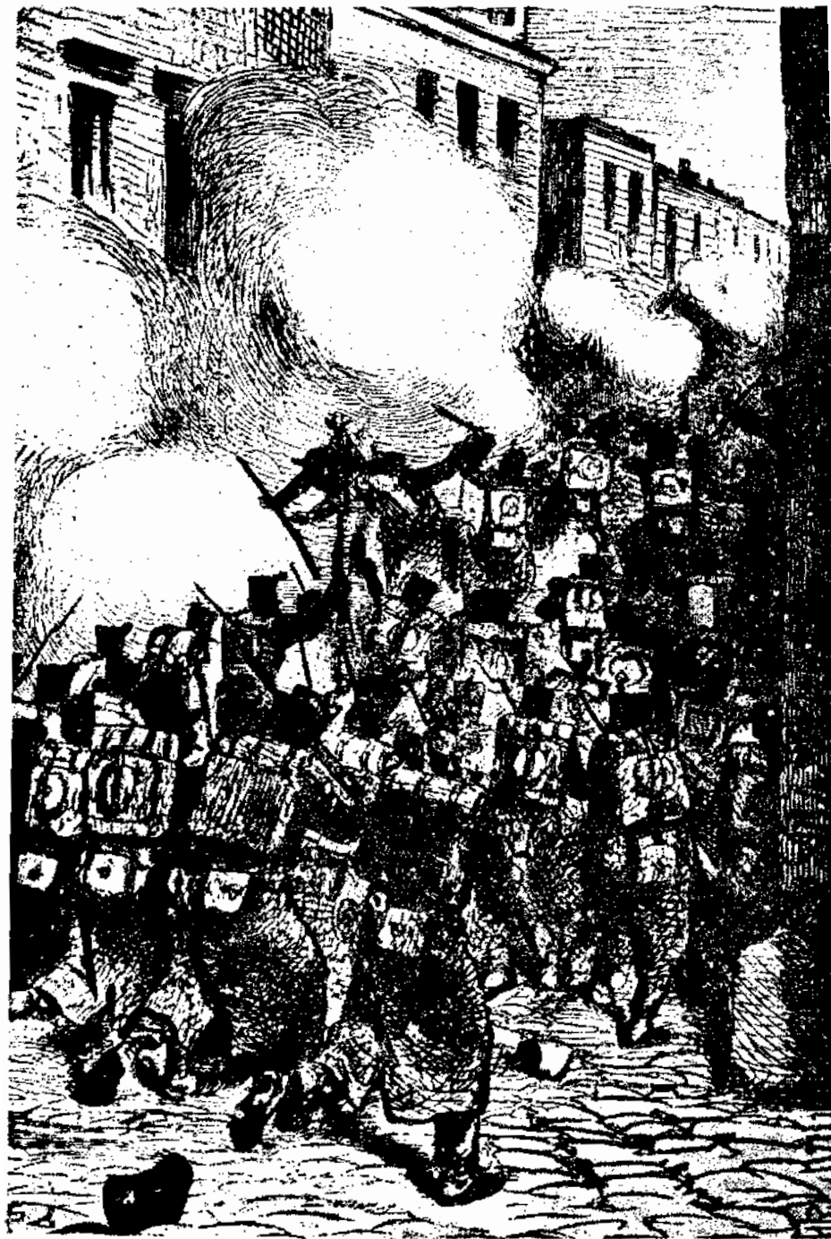
حملات پیاپی تجدید شدند. وحشت بالا گرفت.