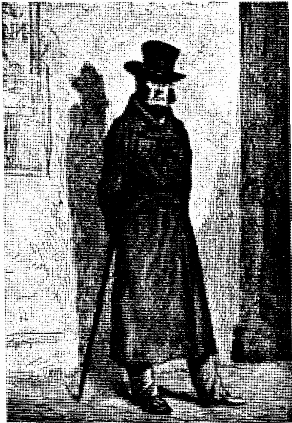
محکم و با تصمیم قوی از باسگاه بیرون آمد.