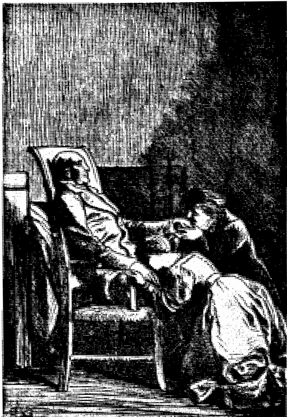
هر يك از آنها روی يك دست او افتاد