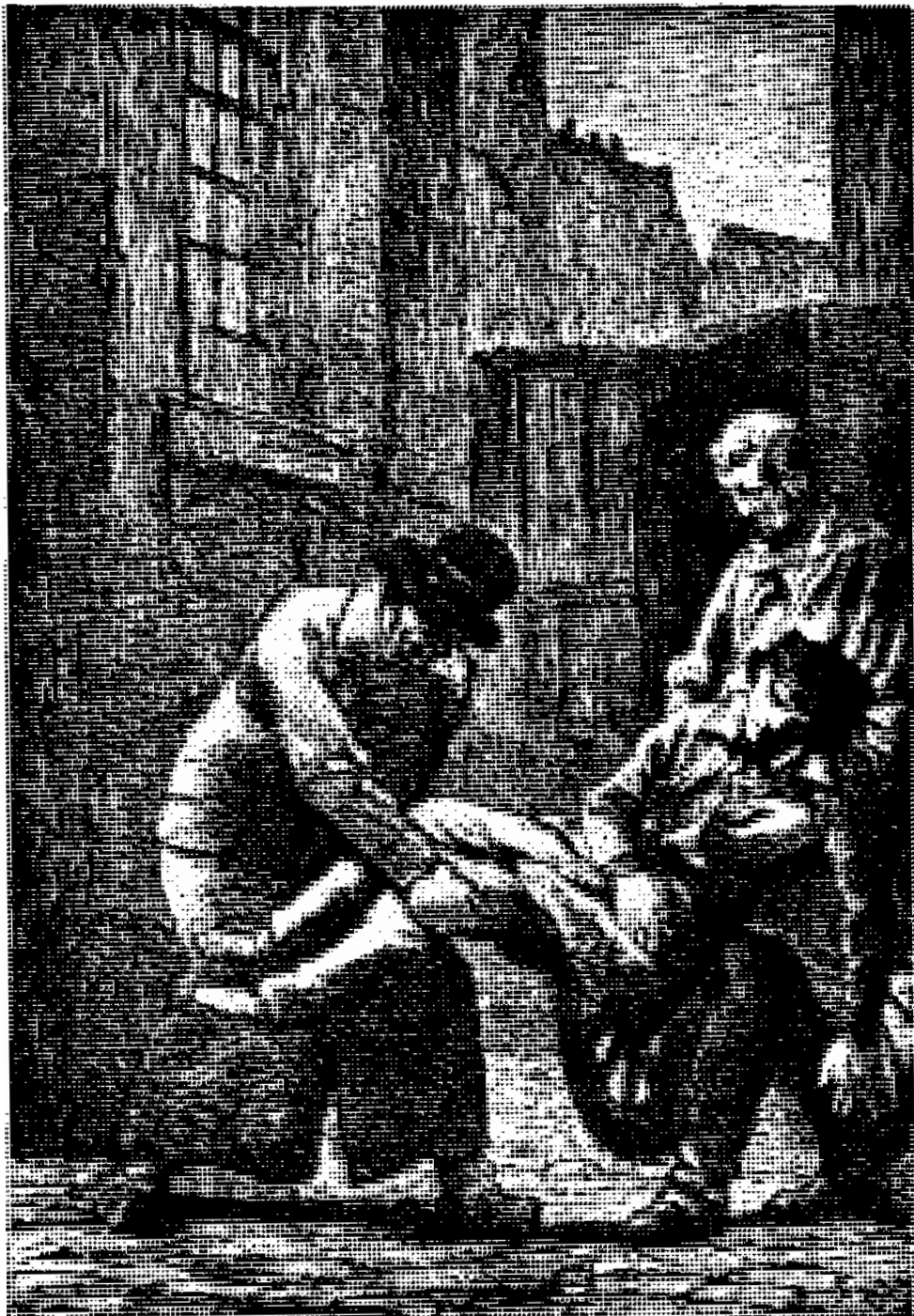
در حالی که او را اینگونه میبرد ....